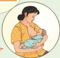
Khi cho con bú