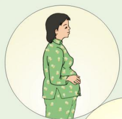
Khi mang thai